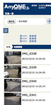
写真 工事写真の閲覧、登録